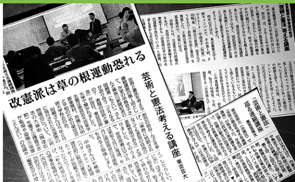
▲各紙が伝える《芸術と憲法を考える連続講座》